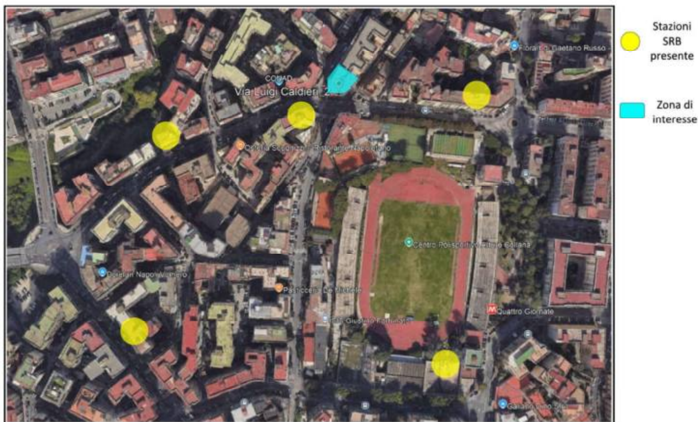
Figura 1 - Panoramica generale dei siti attenzionati presso il Piano 8 di Via Caldieri n.2 – Napoli (NA)

(Long. 14°13'22.94"E, Lat. 40°50'52.10"N)